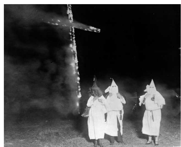
La cruz ardiente es uno de los símbolos de los grupos sectarios del Ku Klux Klan.

Secta es un grupo o movimiento, que exhibe una devoción excesiva a una persona, idea o cosa y que emplea técnicas antiéticas de manipulación para persuadir y controlar (a sus adeptos); diseñadas para lograr las metas del líder del grupo; trayendo como consecuencias actuales o posibles, el daño a sus miembros, a los familiares de ellos o a la sociedad en general. [...] Dado que la capacidad para explotar a otros seres humanos es universal, cualquier grupo puede llegar a convertirse en una secta. Sin embargo, la mayoría de las organizaciones institucionalizadas y socialmente aceptadas, tienen mecanismos de autorregulación que restringen el desarrollo de grupúsculos sectarios. [28]